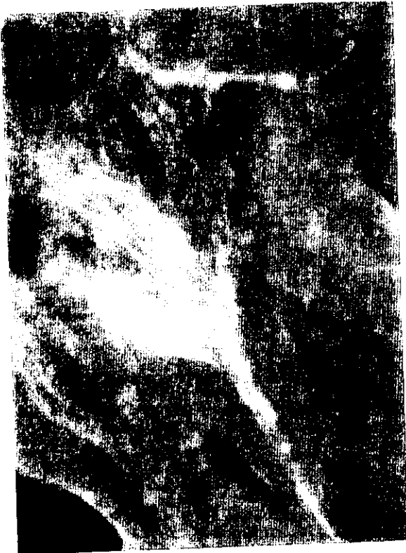
شکل ۳- رویش لوله گرده رقم بلیدی در مادگی رقم ماری