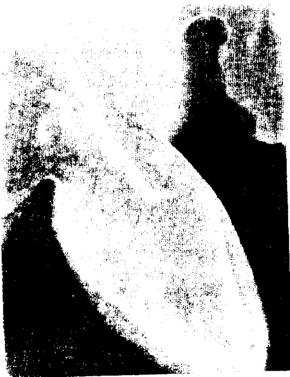
شکل ۴- رشد لوله گرده بلیدی در خامه و میکروپیل تخمک ماری

افشانی نیز نتیجه کمتری نشان داد. در استفاده از دانه گرده بلیدی و مانزانایلا درصد تشکیل میوه نهایی به ترتیب ۳/۷۳ و ۴/۷۶ حاصل شد، در نتیجه جزو ارقام کاملاً سازگار با ماری شناخته شدند. در تیمار مانزانایلا افزایش تشکیل میوه نسبت به گرده افشانی آزاد در سطح احتمال ۱٪ معنی‌دار گردید. اثنی عشری و غلامی (۱۳۷۶) در تحقیق روی گرده افشانی رقم ماری گزارش نمودند میزان تشکیل میوه اولیه در خود گشنی ۲۴/۲۱٪ و گرده افشانی آزاد ۶/۷۳٪ بود. مقایسه میانگین وزن میوه‌های حاصل از تلاقی‌های ماری نشان داد میوه‌های مربوط به تیمار خودگرده‌افشانی نسبت به سایر تیمارها بیشتر بوده و این اختلاف در سطح احتمال ۱٪ نیز معنی‌دار شد. در تلاقی ماری با گرده بلیدی ۸۳/۳٪ رویش لوله گرده حاصل شد. در شکل ۴ رشد لوله گرده تا انتهای خامه راه یافته ولی در نهایت فقط یک لوله‌گرده به تخمدان وارده شده است. رقم مانزانایلا در سال ۱۳۷۸ با ۵ تیمار از لحاظ گرده افشانی مورد بررسی قرار گرفت. در این رقم استفاده از دانه‌گرده رقم زرد موجب تشکیل بالاترین مقدار میوه اولیه و نهایی نسبت به سایر تیمارها شد و نسبت به گرده افشانی آزاد در سطح احتمال ۵٪ تفاوت معنی‌دار نشان داد. جالب توجه اینکه تفاوت آماری موجود بین تیمار زرد و سایر تیمارها (خودگشنی و دگرگشنی) در تشکیل میوه اولیه همچنان در مورد تشکیل میوه نهایی نیز تکرار گردید (جدول ۶). درصد تشکیل میوه اولیه و نهایی تیمارهای بلیدی و ماری نسبت به همدیگر تفاوت معنی‌داری نداشتند و در گروه b قرار گرفتند در نتیجه از نظر طبقه سازگاری این دو رقم نسبتاً سازگار با مانزانایلا محسوب می‌شوند.