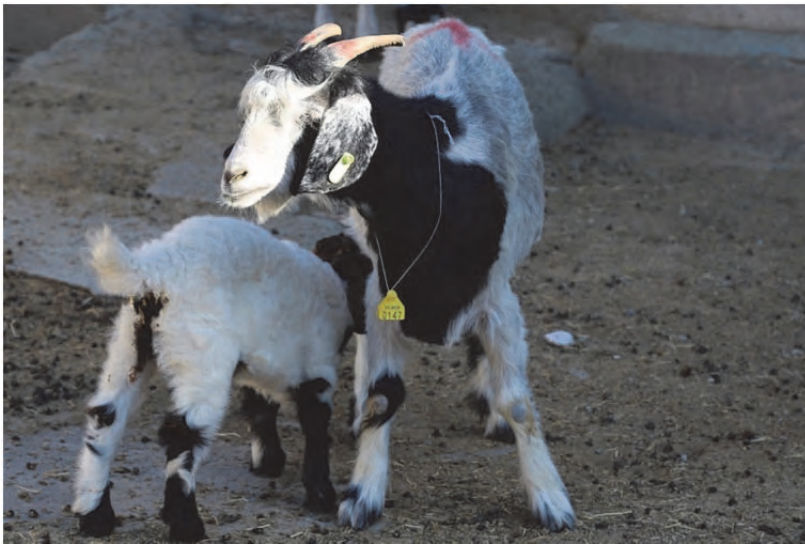
شکل ۳. پلاک گردن

کاربرد این ابزار در گوسفند و بز کم است. ولی در زمان‌های کوتاه مثل فصل زایش برای جلوگیری از اشتباه در ثبت مشخصات میش‌های زاییده و بره‌های آن‌ها می‌توان از این نوع پلاک‌ها به صورت موقت استفاده کرد (شکل ۳). در این مواقع، برای میش و بره‌های آن از پلاک‌هایی با شماره‌های یکسان استفاده می‌شود.