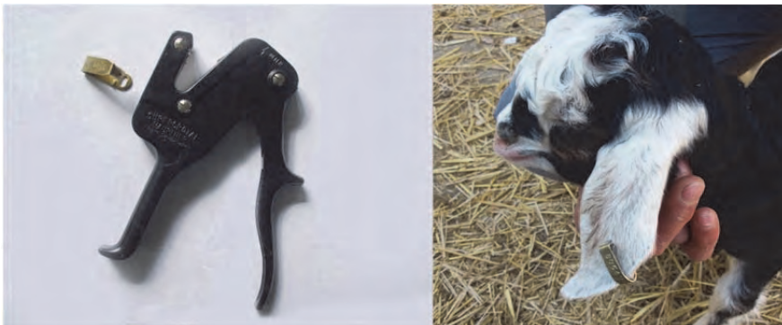
شکل ۶. پلاک فلزی و ابزار آن

این پلاک‌ها دوام بیش‌تری نسبت به انواع پلاستیکی بر روی گوش دام دارند و درصد افتادن و گم‌شدن آن‌ها بسیار کم‌تر است. عیب این پلاک‌ها کوچک‌بودن اندازه و ریزبودن خط آن‌هاست و به همین علت برای خواندن آن‌ها باید دام را مقید کرد و از فاصله نزدیک شماره را قرائت کرد. نکته درخور توجه در این‌گونه پلاک‌ها این است که در موقع نصب آن‌ها بر روی گوش دام باید دقت کرد که حداقل نصف طول پلاک بیرون از گوش دام باقی بماند تا در زمان رشد دام، به گوش آن آسیب نرساند (شکل ۶).