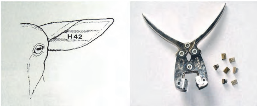
شکل ۴. خال کوبی و ابزار آن