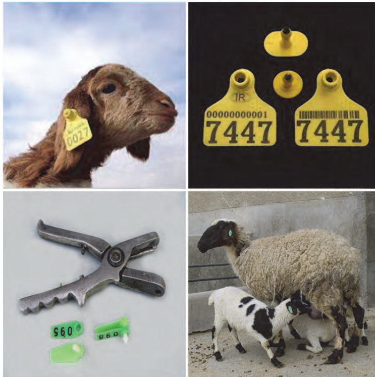
شکل ۷. انواع پلاک پلاستیکی با ابزار آن

نشان داده است که در گوسفند و بز بهتر است از هر دو پلاک فلزی و پلاستیکی استفاده شود.