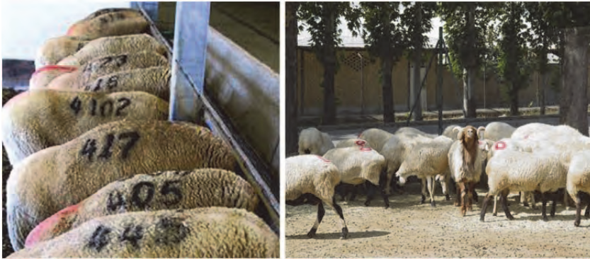
شکل ۱. استفاده از رنگ برای شناسایی گوسفند