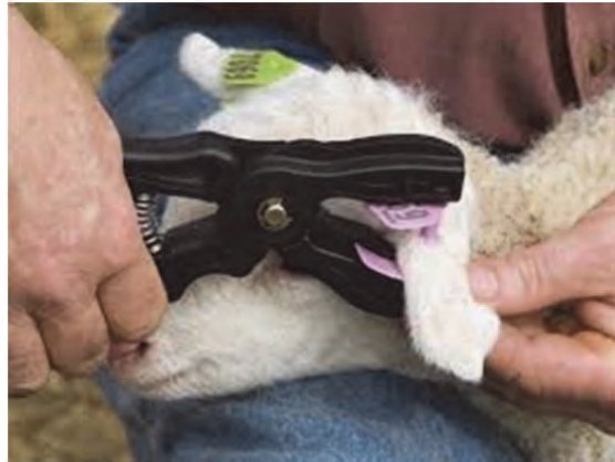
شکل ۸. محل مناسب نصب پلاک در گوش