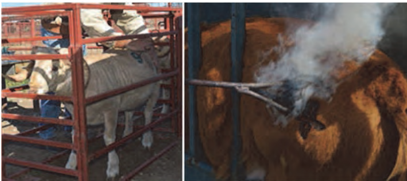
شکل ۲. داغ کردن سرد (راست) و گرم (چپ)

داغ کردن گوسفند در نتیجه سوزاندن پشم یا لایه بیرونی پوست در نواحی صورت، پشت، دنبه، کپل و پهلو انجام می‌شود. چنانچه داغ کردن بر روی پوست انجام شود، می‌تواند جزء روش‌های دائمی محسوب شود. در این روش از فلزی داغ استفاده می‌شود که شماره یا علامتی بر روی آن حک شده است. مزیت این روش شناسایی سریع دام در مواقع ضروری مثل فحل‌یابی و جفت‌گیری است. دو نوع داغ کردن وجود دارد: سرد و گرم (شکل ۲). در نوع گرم از حرارت و در نوع سرد از زت مایع استفاده می‌شود.