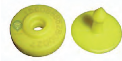
شکل ۱۰. نمونه آراف‌آی‌دی روی پلاک گوش پلاستیکی

شماره ثبت ۱۵ رقمی، شماره منحصر به فردی است که کمیته بین‌المللی ثبت حیوانات (ICAR) تعریفش کرده است. این شماره از ۲ بخش تشکیل شده است. ۳ رقم اول این شماره، کد کشور است و از استاندارد ایزو ۳۱۶۶-۱ تبعیت می‌کند و ۱۲ رقم بعدی هم از استاندارد ایزو ۱۱۷۸۴ تبعیت می‌کند. این نوع از شماره را می‌توان به انواع گونه‌های مختلف دام تخصیص داد. در حال حاضر این وظیفه را قانون نظام جامع دام پروری بر عهده مرکز اصلاح نژاد و بهبود تولیدات دامی گذاشته است که از طریق سامانه جامع هویت و اصلاح نژاد دام کشور، به صورت مکانیزه انجام می‌شود. شماره ثبت بین‌المللی ۱۵ رقمی را می‌توان در داخل میکروچیپ (مورد استفاده در حیوانات خانگی و اسب)، بلوس آراف‌آی‌دی ۱ (دستگاه شناسایی فرکانس رادیویی) که به دام خورانده شده و در شیردان مستقر می‌شود یا چیپ موجود در پلاک گوش آراف‌آی‌دی ذخیره کرد یا اینکه می‌توان روی پلاک گوش پلاستیکی مخصوص حک کرد (شکل ۱۰). البته هر کدام از این وسایل باید استاندارد خاص خود را داشته باشد.