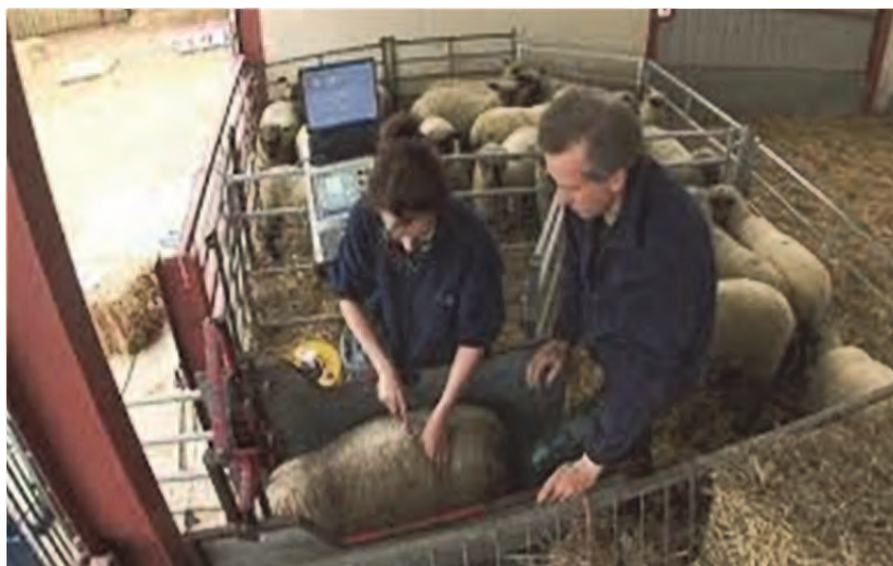
شکل ۱۱. روش مقید کردن گوسفند برای هویت‌گذاری

پیش از شروع هر نوع عملیات هویت‌گذاری لازم است گوسفند یا بز را مقید کرد. مقید کردن دام باتوجه‌به جثه و قدرت آن و همچنین نوع عملیات مدنظر متفاوت است. برای نصب انواع پلاک (فلزی و پلاستیکی)، پلاک گردن و اسپری کردن فقط مقید کردن سر حیوان کافی است. ولی برای داغ کردن سرد و گرم، سوراخ کردن گوش، خال کوبی گوش و نصب میکروچیپ باید حیوان را در جایگاه مخصوص انفرادی مقید کرد (شکل ۱۱).